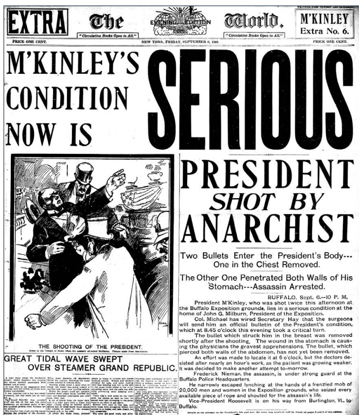
Slika 3: Šesta posebna edicija večerne izdaje Pulitzerjevega Worlda o atentatu na Ameriškega predsednika Williama McKinleyja, ki je bil ustreljen ob štirih popoldan.

brutalnem tempu dela, ki je potekalo v več izmenah, zaradi česar so številni uredniki in novinarji bodisi hitro odšli iz poklica ali redno zbolevali. Po vsej verjetnosti je šlo v mnogih primerih za izgorelost, saj novinarji le redko niso bili v skoraj neprekinjenem pogonu, družin pa skoraj niso videli. Pulitzerjev nebotičnik je imel celo prostore, v katerih so novinarji lahko prespali, ker je bil delovni dan pogosto predolg, pri številnih zgodbah pa je bila ključna ažurnost.