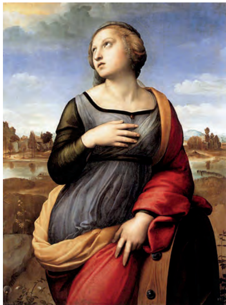
Santa Caterina d'Alessandria (Raffaello, 1508). Raffaello je bil eden od najbolj cenjenih renesančnih slikarjev

duhovne popolnosti (Jenks, 1993: 16). Tu gre za to, da so britanski literarni kritiki pod vplivom nemške romantike povzdigovali pomen kulture . Njihovo stališče je bilo, da ima zgolj kultura moč, da »človekovega duha dvigne iz njegove povprečnosti v višine lepote, svetlobe, življenja in sočutnosti« (glej: Arnold, 1995: 30). Konkretno naj bi kultura pozitivno vplivala tako na