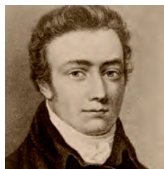
Samuel Taylor Coleridge

Britanski literarni kritiki, ki se pri svojih analizah torej niso osredotočali zgolj na literarna dela, pač pa so pisali tudi o kulturi nasploh, so posledično poskušali človeštvo odrešiti njegove ujetosti v problematične učinke industrializacije oziroma modernizacije. Pri tem svojem prizadevanju so bili celo nekoliko blizu številnim revolucionarno razpoloženim mislecem iz tistega časa (na primer Karlu Marxu, ki ga bomo omenjali v nadaljevanju), ki so prav tako težili k spremembi razmer, toda njihova pozornost ni bila usmerjena k pravičnejši distribuciji družbenega bogastva, kot je to veljalo za revolucionarje. Namesto tovrstne materialistične vizije jih je namreč vodilo ravno nasprotno – idealistično – prepričanje, da lahko človeštvo pride iz krize zgolj tako, da sledi idealu