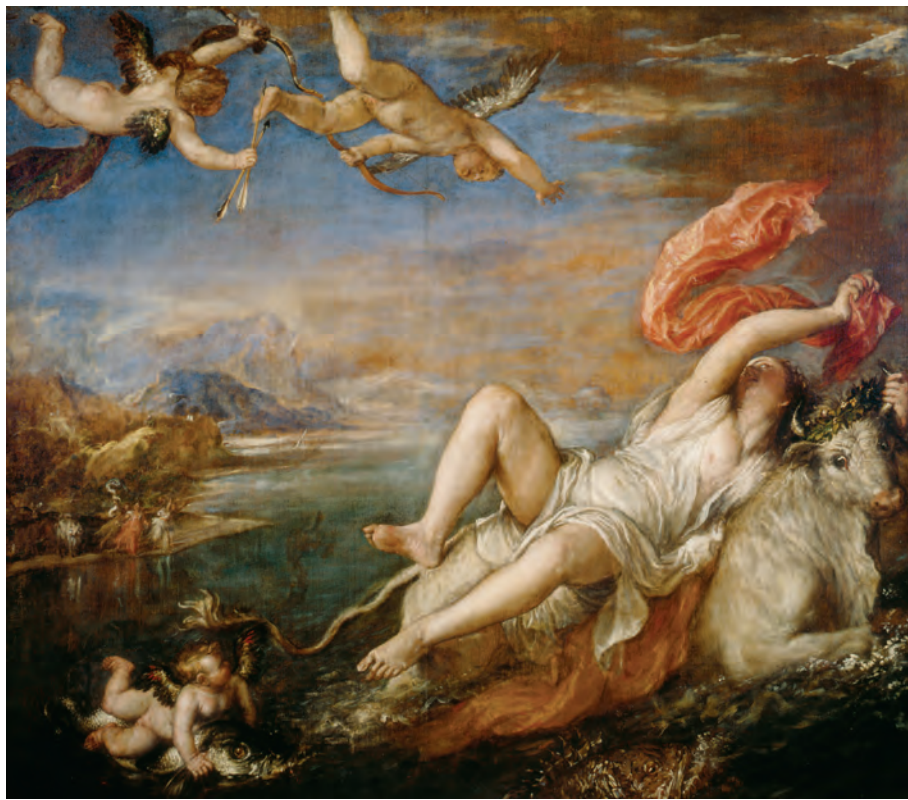
Kultura kot umetnost: Il ratto d'Europa (Tiziano, 1562)

življenja, tretji kulturo obravnavajo kot različne vsakdanje prakse (kultura oblačenja, kultura prehranjevanja ipd.), spet četrte kultura zanima v ekonomskem smislu, peti opozarjajo na pomen kulture kot ideologije in podobno.