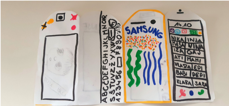
Slika 3: Izdelava mobilnega telefona (deklica, 8 let)