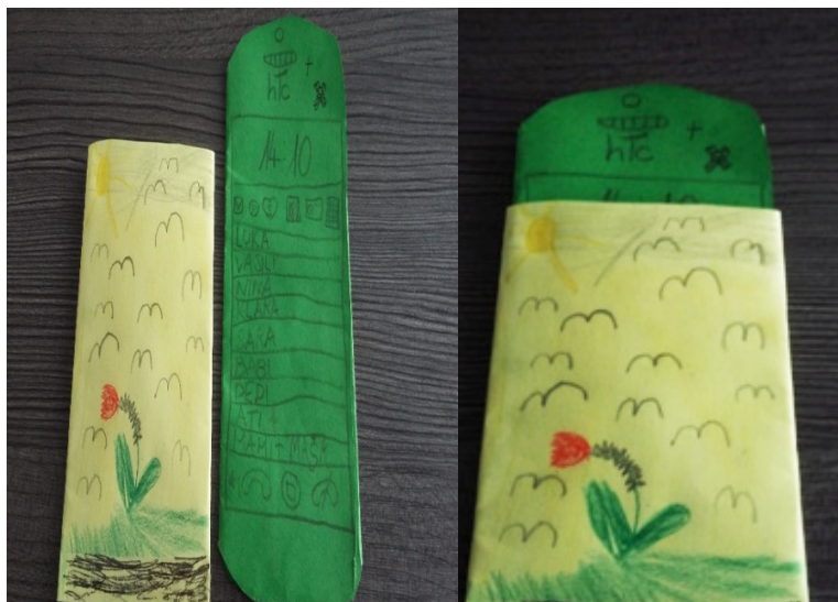
Slika 2: Izdelava mobilnega telefona (deček, 6 let; deklica, 8 let)