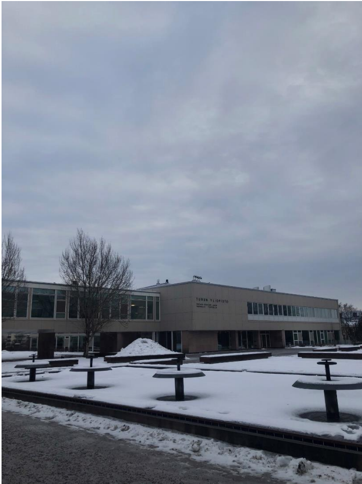
Slika 3 Glavna stavba univerze

Univerza v Ljubljani Fakulteta za družbene vede