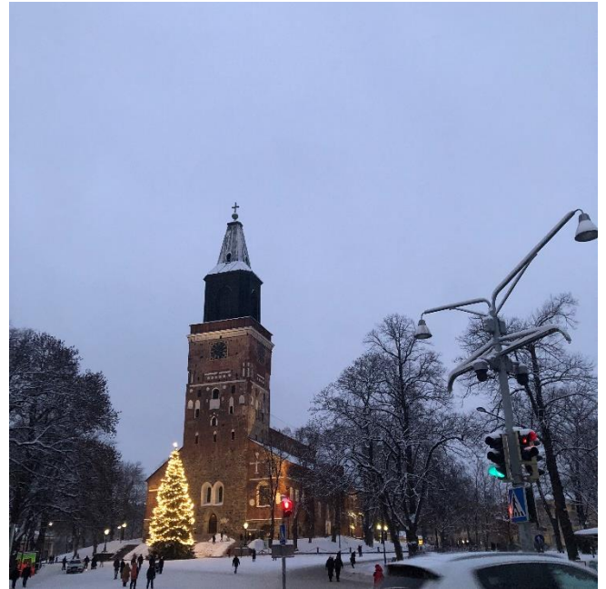
Slika 2 praznično okrašeno mesto